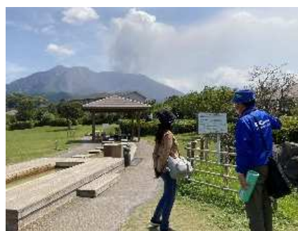
▲雄大な桜島や100mの足湯のそばで