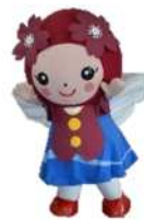
サクラエンジェルちゃん