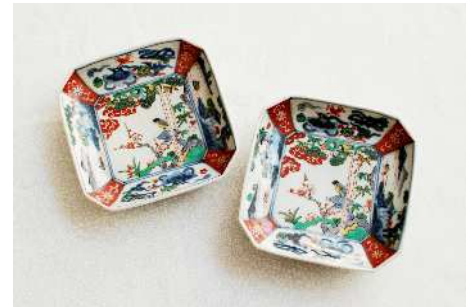
愛用の器（赤絵の隅切皿、通称「海苔のお皿」）