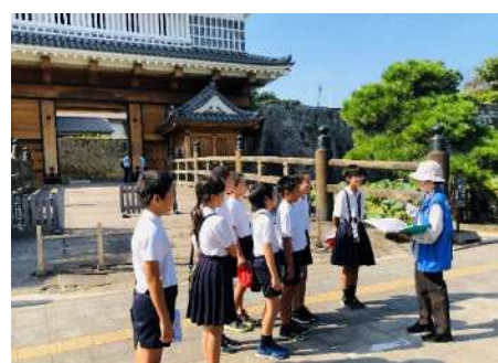
▲修学旅行の班別学習でも大人気