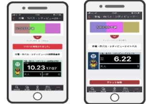
【スマホー日乗車券】 【ナイトパス】