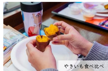
やきいも食べ比べ