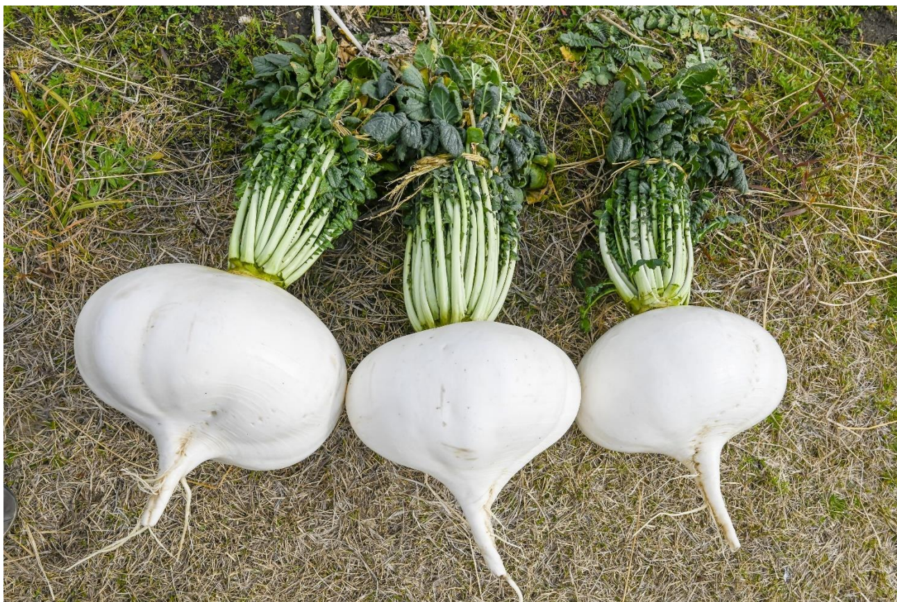
鹿児島の冬を代表する特産品 「桜島大根」