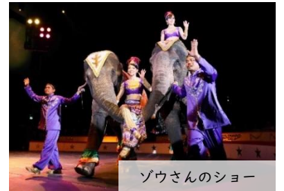
ゾウさんのショー