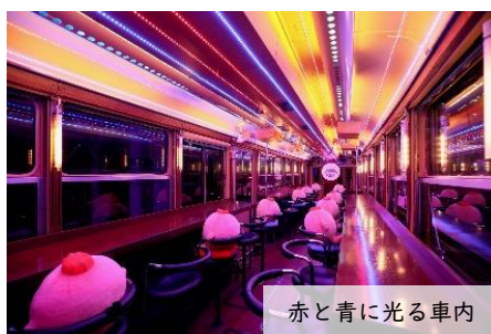
赤と青に光る車内