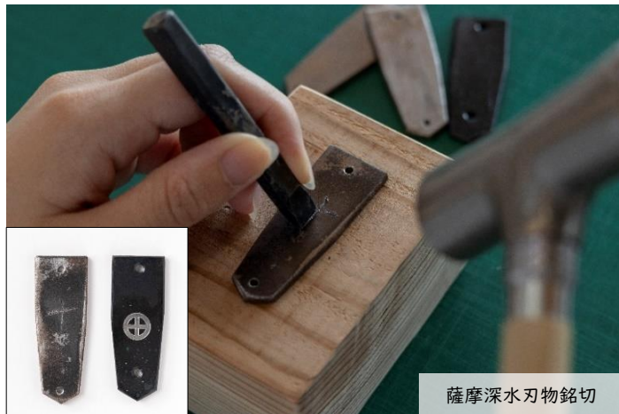
薩摩深水刃物銘切