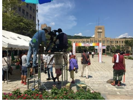
▲映画「ゆずの葉ゆれて」の撮影風景

鹿児島ファンアプリ「わくわく」を使って5カ所のスタンプを集めて応募すると、鹿児島市の特産品詰め合わせなどが抽選で当たります。