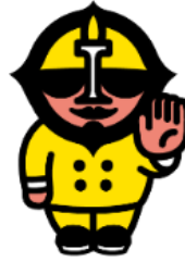
交通局マスコットキャラクター バスでん仮面

専用アプリをダウンロードしたスマートフォンなどで各乗車券を購入し、市電・市バス降車時に乗車券画面を乗務員へ提示してください。