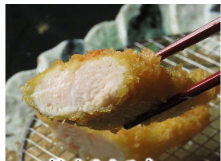
極上ささみかつ 1本 390円 (税込462円)

980円 (税込1078円) 780円 (税込858円) 680円 (税込748円)