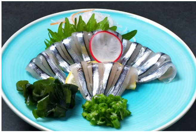
きびなごの刺身 690円 (税込759円)