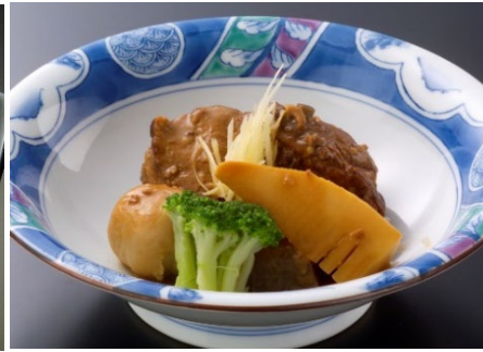
黒豚軟骨煮込み 590円 (税込649円)