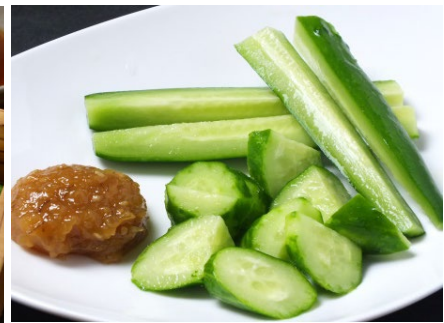
黒豚味噌キュウリ 390円 (税込429円)