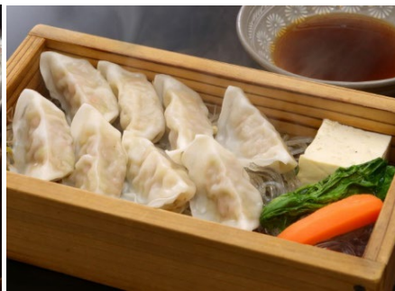
蒸したて黒豚蒸し餃子 690円 (税込759円)