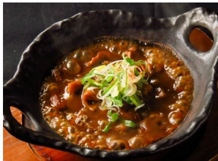
黒豚ホルモン煮込み 390円 (税込429円)