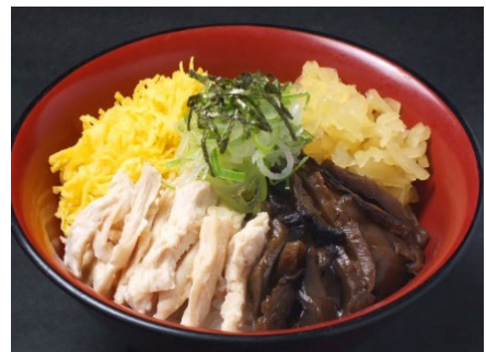
六白亭風 鶏飯 980円 (税込1078円)