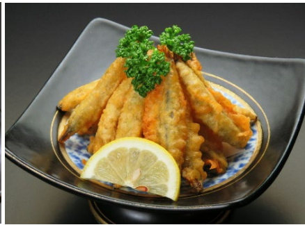
きびなごの天婦羅 490円 (税込539円)