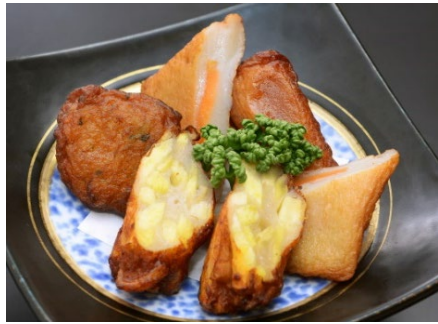
さつま揚げ3種盛り 490円 (税込539円)