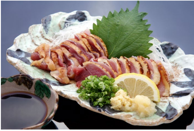
とりさし 690円 (税込759円)