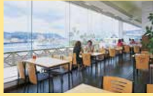
餐廳「海豚廚房」(2樓) 可在品嚐美食的同時盡享海濱風光。