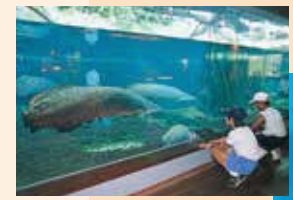
展示世界最大的淡水魚——象魚。